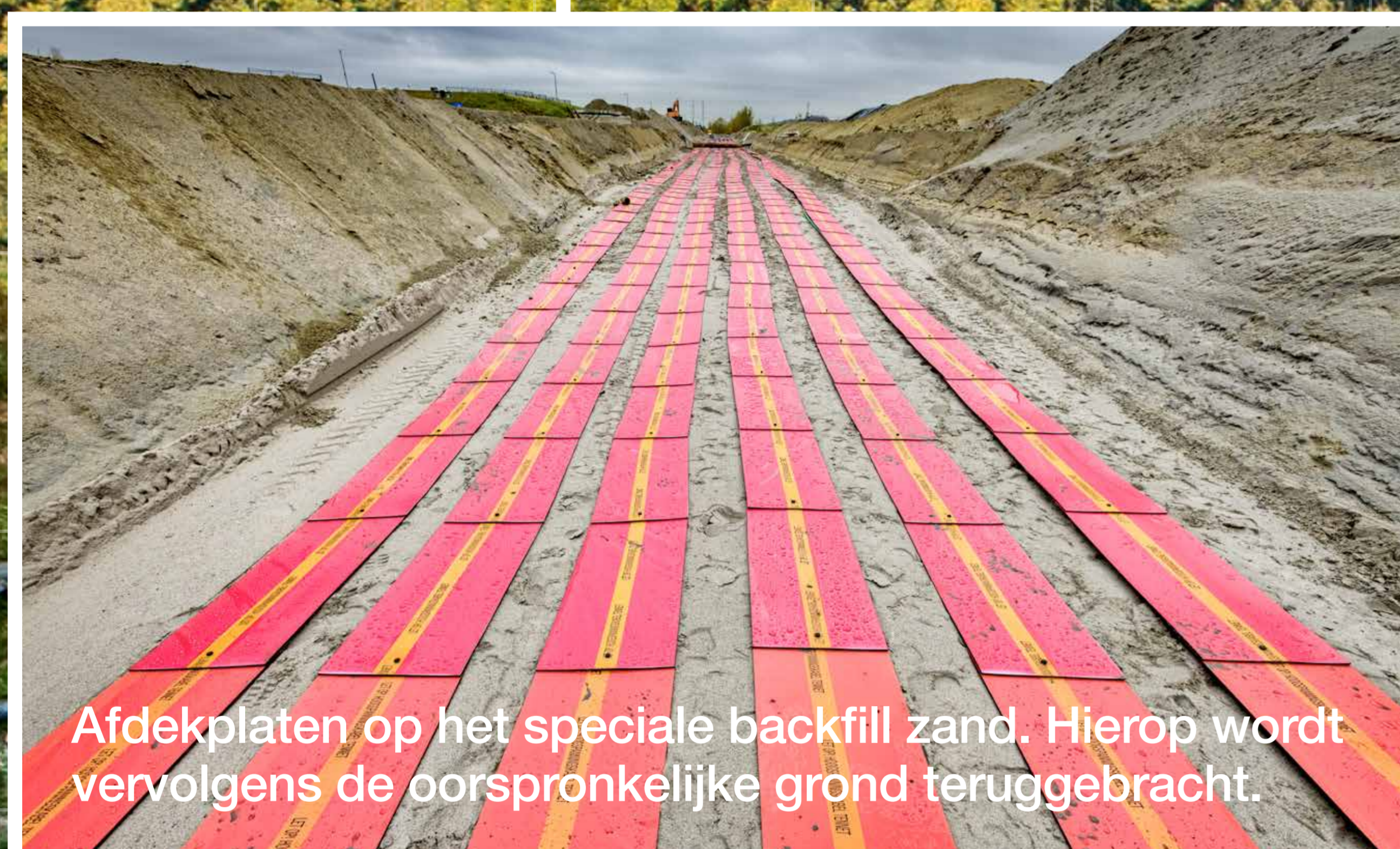
Afdekplaten op het speciale backfill zand. Hierop wordt vervolgens de oorspronkelijke grond teruggebracht.