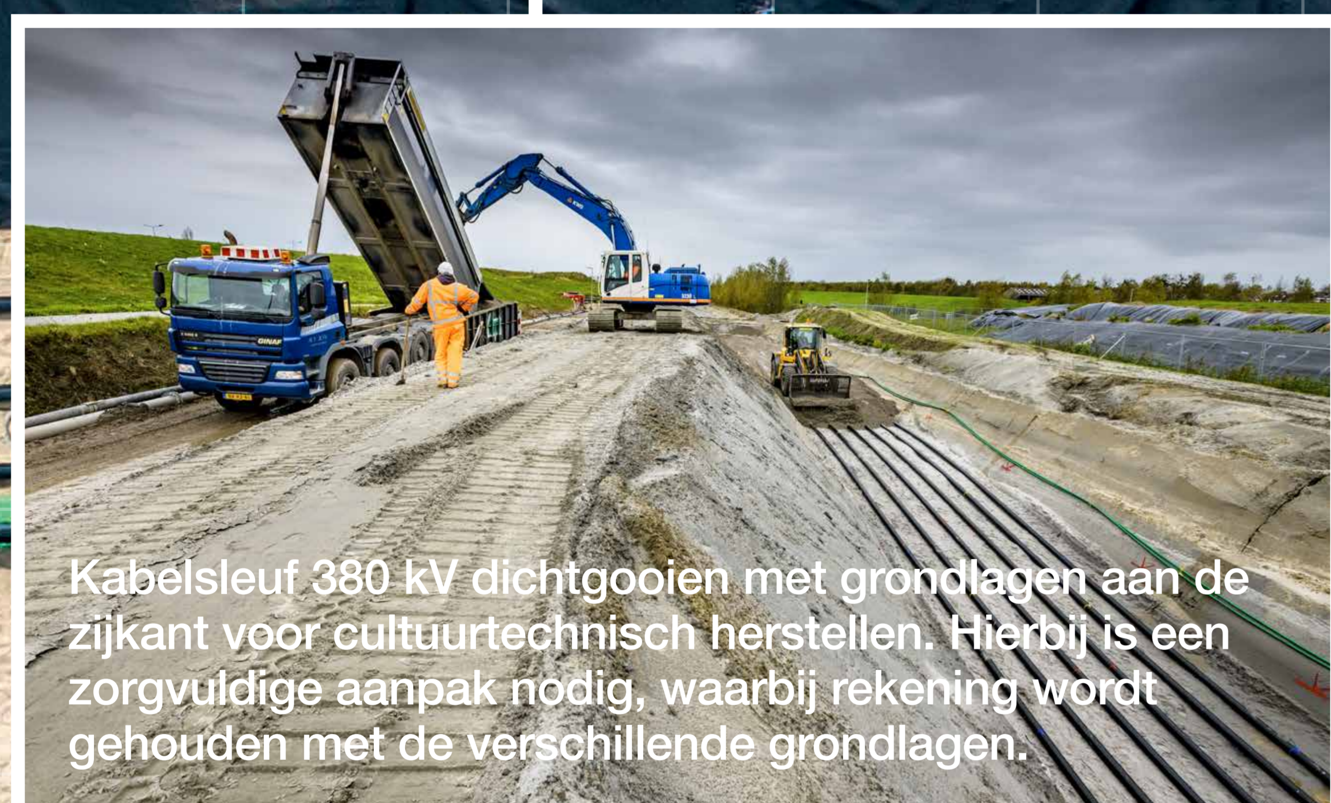
Kabelsleuf 380 kV dichtgooien met grondlagen aan de zijkant voor cultuurtechnisch herstellen. Hierbij is een zorgvuldige aanpak nodig, waarbij rekening wordt gehouden met de verschillende grondlagen.